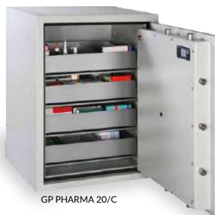
GP PHARMA 20/C