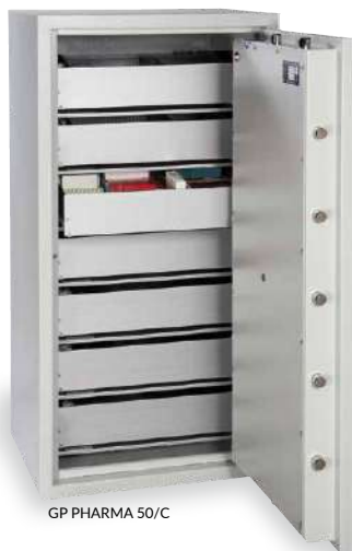
GP PHARMA 50/C