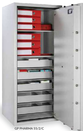
GP PHARMA 55/2/C