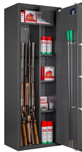
Art. WF 145 KOMBI