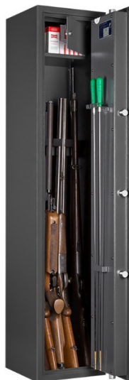
Art. WF 145-5