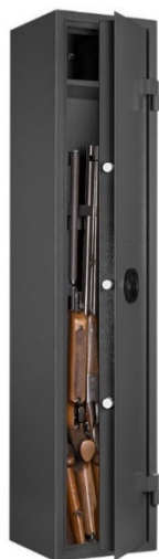
Art. WF 103