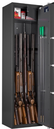
Art. WF 145-7